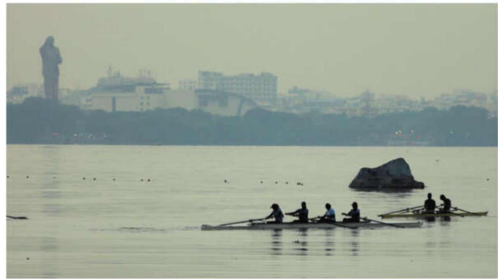
On a pleasant evening, people seen rowing at Hussainsagar in Hyderabad on Monday

Among those transferred to KGH, one girl is said to be in a very critical condition.